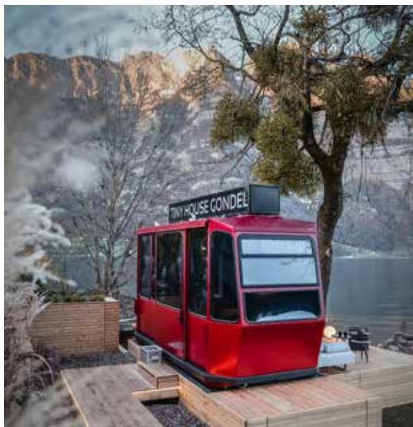
Tiny House Gondel mit Blick auf die Churfürsten

Das lofthotel und die sagibeiz sind Betriebe, die stets neue Konzepte und Ideen entwickeln und umsetzen. In der ehemaligen Spinnerei und der Sägerei am See können die Gäste erleben, wie aus Altem Neues entsteht, wie nachhaltig investiert und einzigartige Angebote kreiert werden.