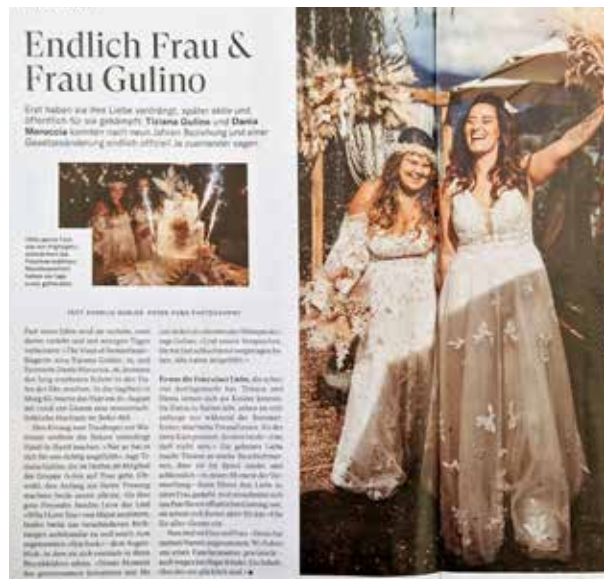
Ausschnitt Bericht Schweizer Illustrierte

Mit dem neuen Ehegesetz dürfen nun auch gleichgeschlechtliche Paare den Bund der Ehe eingehen. Dass wir schon mehrere solche Hochzeitsfeste ausrichten durften, freut uns ganz besonders.