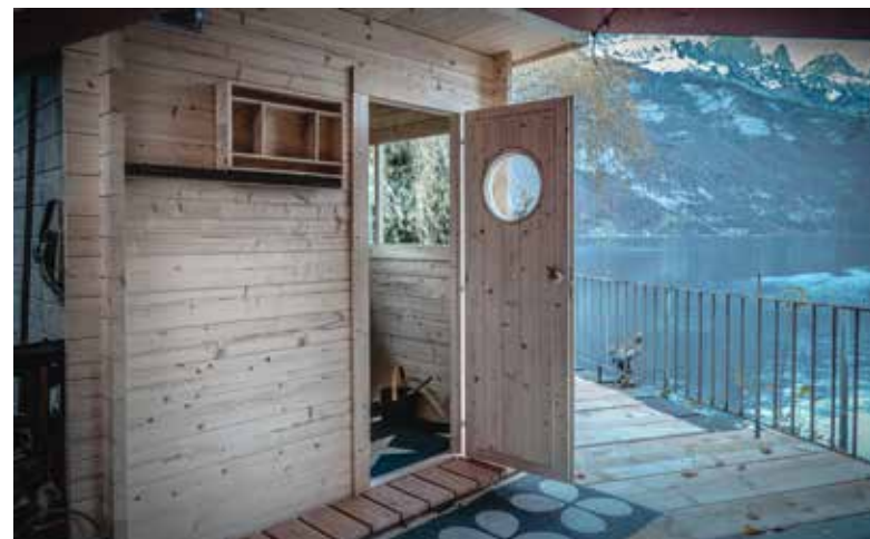
Sauna und Sicht von der Sauna aus

Die Seesauna ist auch für externe Gäste buchbar, ebenso wie die Tennishalle und der separate Wellness- und Fitness Bereich in der alten Spinnerei. Die Reservationen erfolgen über die lofthotel Reception. ■