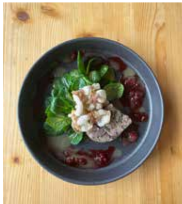
Delikatesse aus der Küche