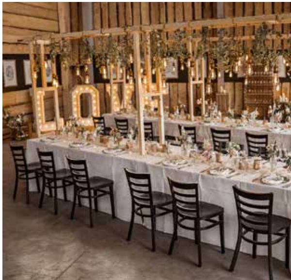
Hochzeit im Holzlager

Einmal mehr durften wir als Ort vieler fröhlicher Zusammenkünfte dienen. Begegnungsorte werden in der stark digitalisierten Welt immer wichtiger. Hier können gemeinsam Emotionen gelebt und geteilt werden. Hier wird gefestigt, getröstet, geliebt und dem Genuss gefrönt.