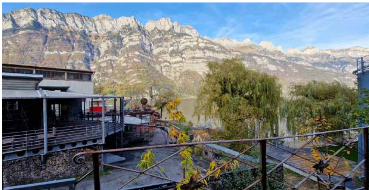
Blick vom Bahnwagon